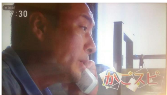
NHK 総合「かごスピ」ドキュメンタリー（全国放送）