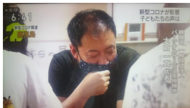
NHK 総合「情報WAVE かがしま」(自殺相談)